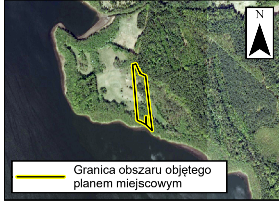
Granica obszaru objętego planem miejscowym