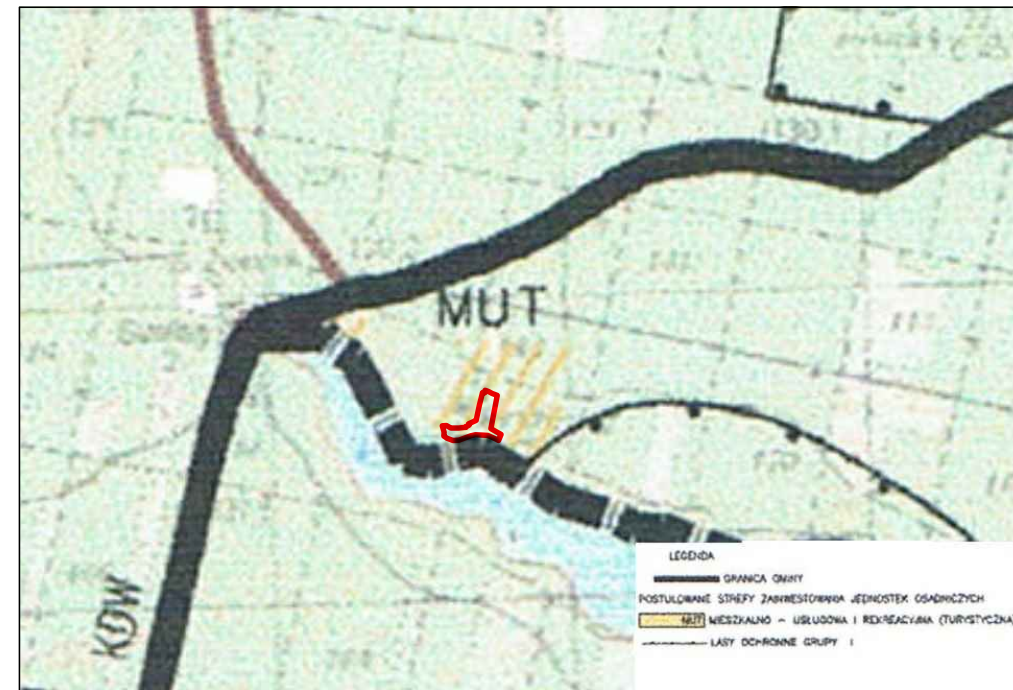
GRANICA OPRACOWANIA PLANU