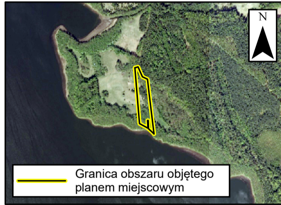
Granica obszaru objętego planem miejscowym