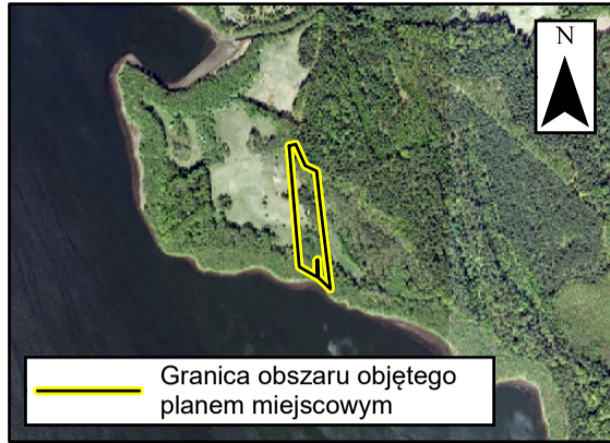
Granica obszaru objętego planem miejscowym