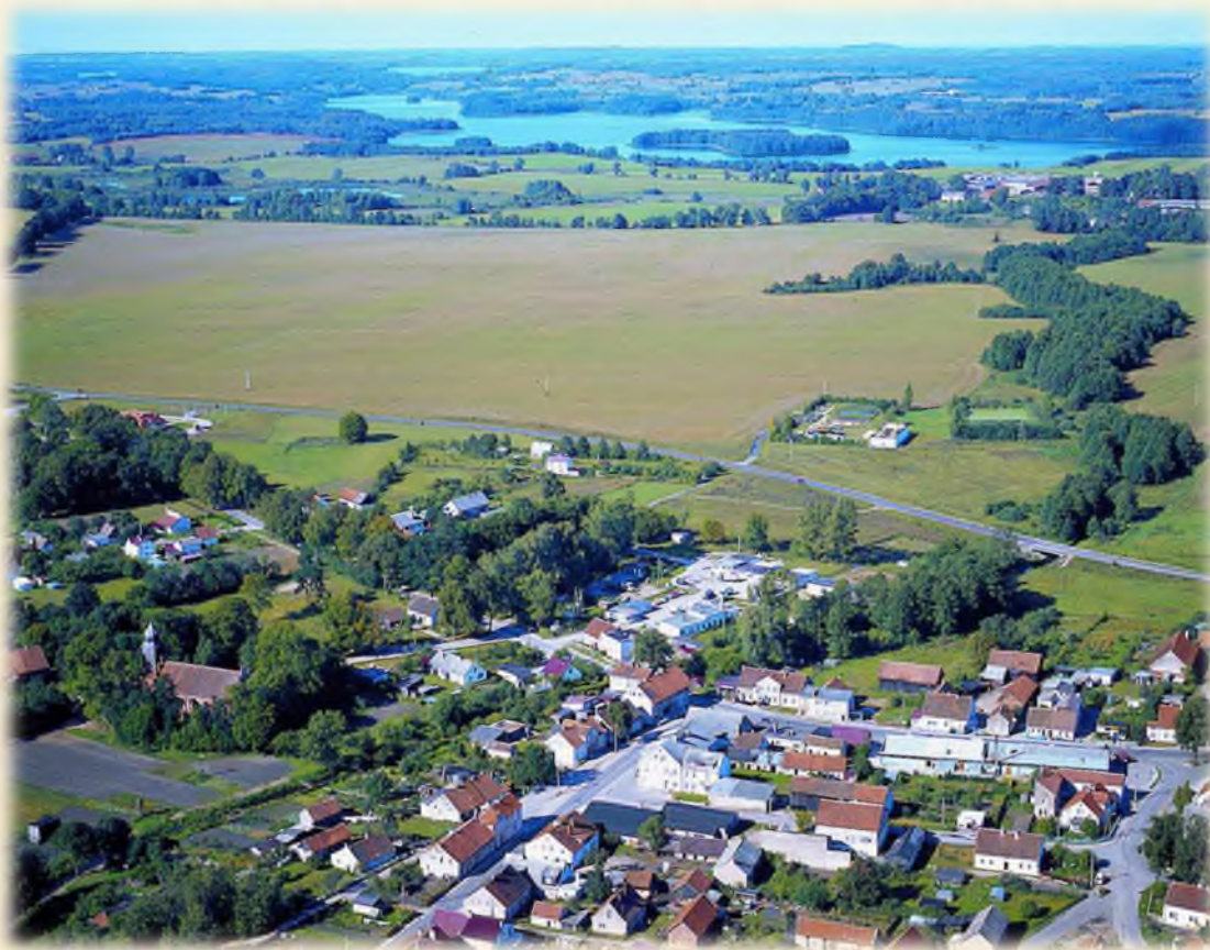
Łukta z lotu ptaka